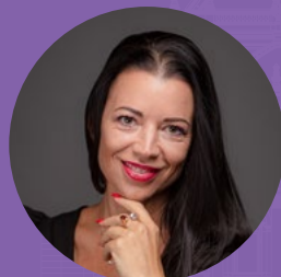
RADINA DACE a Magyar Nemzeti Balettintézet művészeti vezetője, balettmester, egykori magántáncosnő